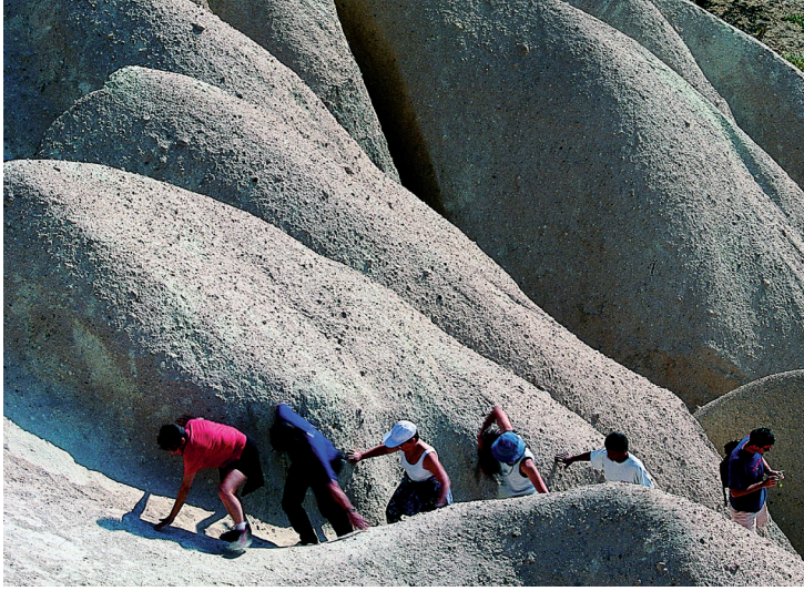
Randonnée au départ de Göreme.

étages servaient d'habitation aux nonnes. Au premier étage, on trouvait le réfectoire, la cuisine et des chambres.