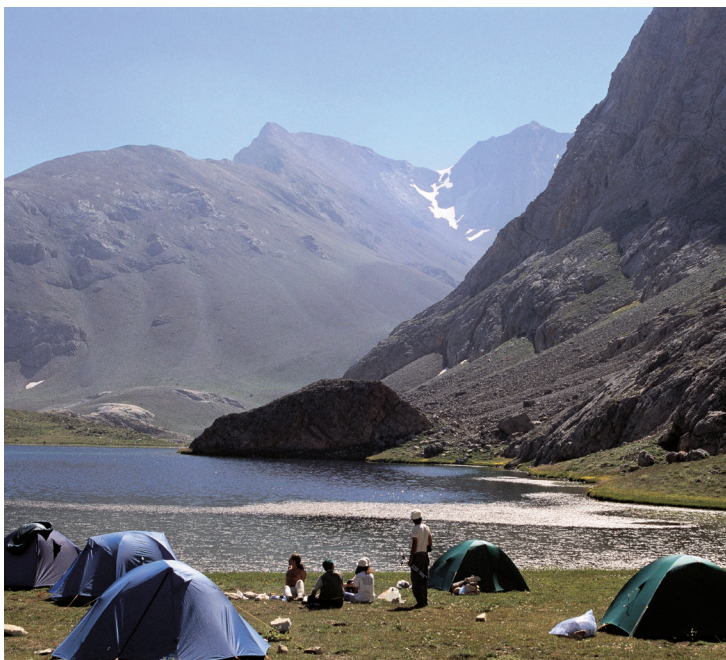
Campement face aux montagnes Bolkar.