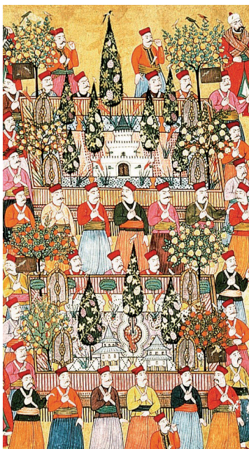
Miniature de la période Ottomane.