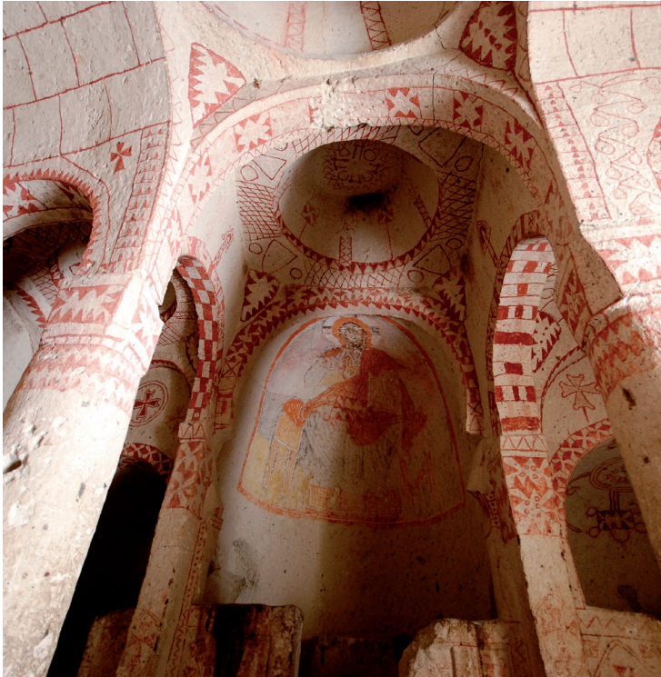
L'église Sainte Barbara.

Composé de deux nefs séparées par des colonnes et des absides, l'édifice possède une double frise représentant différents saints.