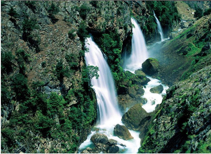
Les cascades de Kapuzbaşı.

la vallée d'Emli. Entourés de forêts de conifères, ces lacs naturels sont un véritable paradis pour les oiseaux et d'autres animaux.