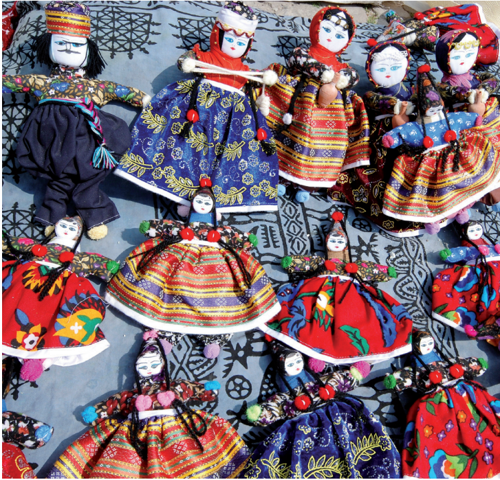
Les poupées traditionnelles de Cappadoce.

tion de Zelve. Un lieu unique où les religieux et surtout les ermites se réfugièrent en s'installant au sommet des cheminées de fée ! Parfois, ces d'habitations culminaient à une dizaine de mètres de hauteur. D'après les historiens, ces ecclésiastiques