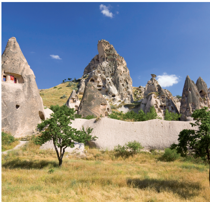
La campagne environnante d'Ortahisar.

pois chiches ( Nohutlu Yahni ), le riz pilaf Zerde, ou encore les haricots secs en cassolette ( Çömlekte Kuru Fasulye ).