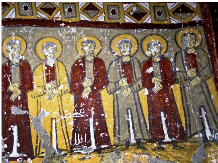
Fresque dans l'église aux Serpents.

riante qui contraste fortement avec les autres sites de Cappadoce. Au milieu d'un canyon creusé dans le tuf coule la Melendiz : une rivière bordée d'églises rupestres datant du VI e siècle où s'installèrent les moines. Un lieu d'isolement et de retraite propice à l'évasion.