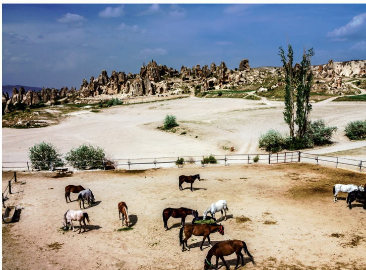
La Cappadoce, le pays des chevaux.