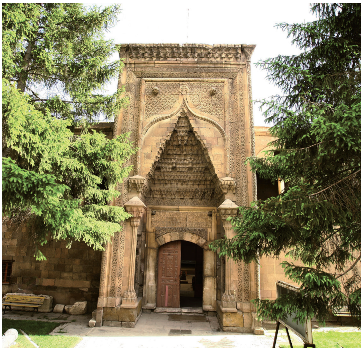
Akmedrese (la medersa Blanche) à Niğde.