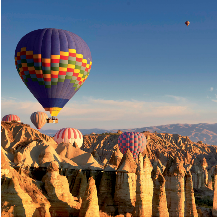
La Cappadoce en montgolfière.

Septembre-Octobre : festival de gastronomie traditionnelle de Cappadoce à Göreme.