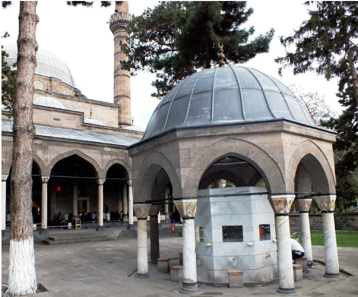
Mosquée Kurşunlu à Kayseri.

Situé dans une jolie demeure construite entre 1419 et 1497, connue sous le nom de Güpgüpoğlu Konağı , le musée présente des collections illustrant la vie