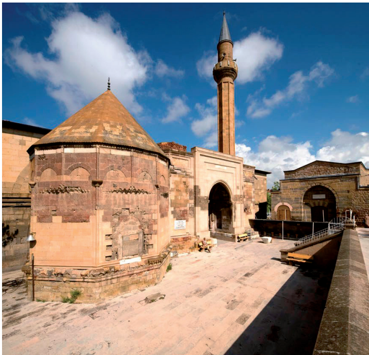
Mosquée de Sungur Bey à Niğde.

Ce musée, qui occupe deux bâtiments de l'ancienne medersa d'Akmedrese, possède une collection de près de 10.000 objets couvrant les périodes paléolithique, néolithique, chalcolithique, hittite, phrygienne, hellénistique, romaine, byzantine, seldjoukide et otto-