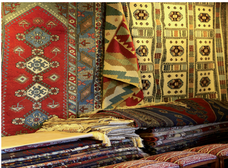
Avanos est spécialisé dans la production de kilims colorés.

tant à plusieurs siècles et qui consiste à utiliser le tour pour modeler l'argile avec les pieds ! L'un de ces potiers, Galip , a eu l'idée de créer dans son atelier un musée du Cheveu. Tout est parti de la décision de garder une mèche de cheveux d'un ami qui quittait Avanos. Depuis, les femmes visitant l'atelier ont été invitées à faire de même.