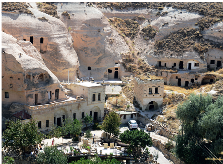
Le charmant village de Çavuşin.

royaume de Commagène, ou même celui d' Alexandre le Grand . Selon une autre légende, l'histoire du tumulus serait liée au voyage d'un derviche dans la région. De passage à Avanos, le religieux aurait demandé de la nourriture à un riche propriétaire, lequel le repoussa vertement. Le derviche invoqua alors la justice divine et toutes les meules à grain de l'agriculteur se transformèrent en blocs de pierre. Une autre croyance suggère que le tumulus abriterait une grande cité troglodytique. Et compte tenu de sa taille et de son emplacement – en face du mont Erciyes, que l'on identifie habituellement au culte de Zeus –, beaucoup d'historiens pensent que l'endroit renferme la sépulture d'un personnage important.