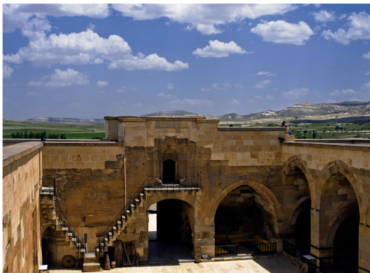
Caravansérial de Saruhan.

Située à 950 m d'altitude, la vallée de Dereyamanlı est l'une des plus intéressantes de la région. Le site abrite de nombreuses cheminées de fée, ainsi qu'une belle église. Un chemin de charretier permet d'y accéder.