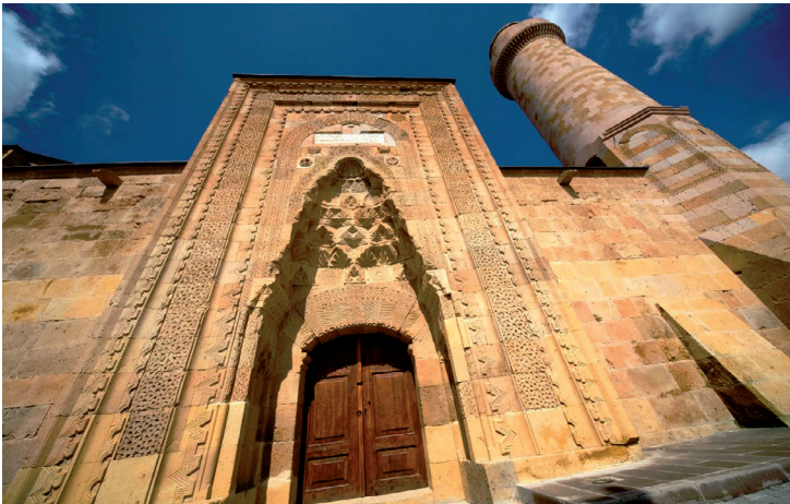
Mosquée Alâeddin à Kayseri.

Au nord-est de la ville. Kale Önü Cad-desi .