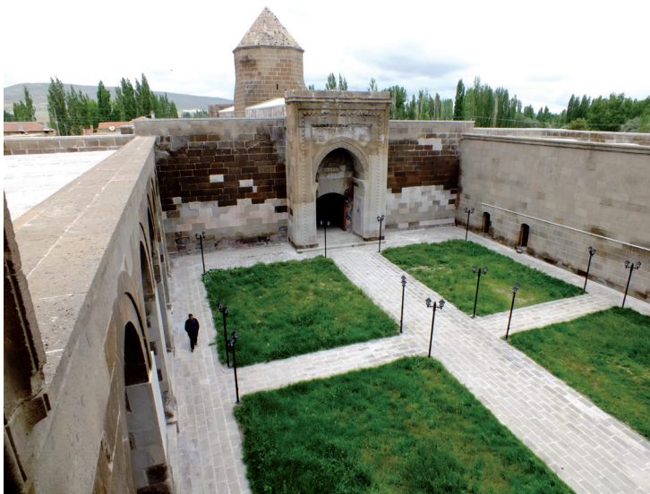
Caravansérail de Karatay à Kayseri.

Kanesh n'est autre qu'une importante cité hittite. Il y a 2 000 ans, le site abritait un centre d'échanges et de commerce florissant où travaillaient les Assyriens. Le lieu est principalement connu pour ses objets et ses tablettes rédigés par les marchands, aujourd'hui exposés au Musée archéologique de Kayseri et au musée des Civilisations Anato-liennes d'Ankara. On y trouve des écrits correspondant à des contrats commerciaux, des décisions judiciaires ou encore à des livres de comptabilité. Un formidable témoignage des premiers peuples de Cappadoce. Le quartier des marchands (Karum) , construit dans la partie basse de Kanesh, se distinguait par ses larges voies et ses places. Les habitations étaient regroupées par blocs composés de maisons, de commerces et de bureaux. C'est là que les archéologues ont retrouvé une importante collection de vaisselle : bols en céramique, vases en terre cuite et des objets en métal. Les tombes étaient généralement construites sous les maisons. Leurs fouilles ont permis de découvrir de véritables trésors, notamment des armes et des bijoux. Si aucun édifice religieux n'a été trouvé, les historiens sont parvenus à identifier des ateliers artisanaux où travaillaient des céramistes et des métallurgistes. Les archéologues pensent