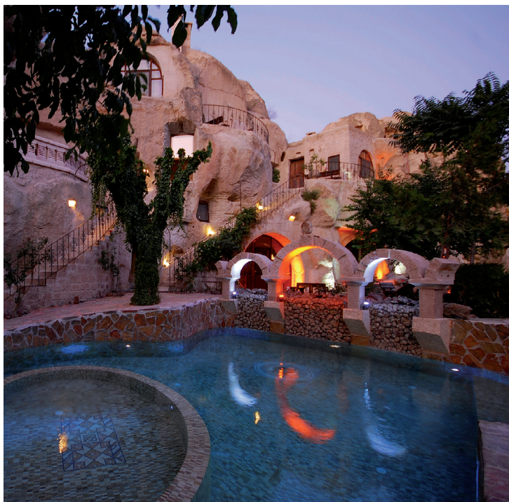
L'hôtellerie de luxe en Cappadoce.

pittoresques et variés, la région attire chaque année des millions de touristes. Depuis 20 ans, l'offre hôtelière s'est fortement enrichie. À travers toute la région, on a vu apparaître des hôtels haut de gamme destinés à une clientèle internationale. L'attractivité du tourisme réside principalement dans la diversité de la Cappadoce : histoire, religion, nature, sport, gastronomie. Une large palette qui explique l'attrait d'une région au charme sans égal.