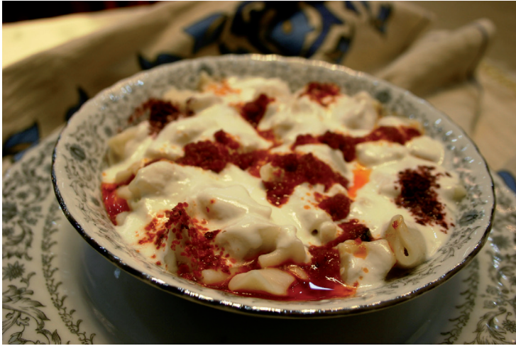
Les mantı sont de délicieux raviolis turcs nappés de sauce au yaourt et à l'ail.

des Ottomans : artisanat, céramiques, documents de l'époque. Vous pourrez également découvrir le quotidien des habitants sous l'Empire ottoman à travers de fidèles reconstitutions.