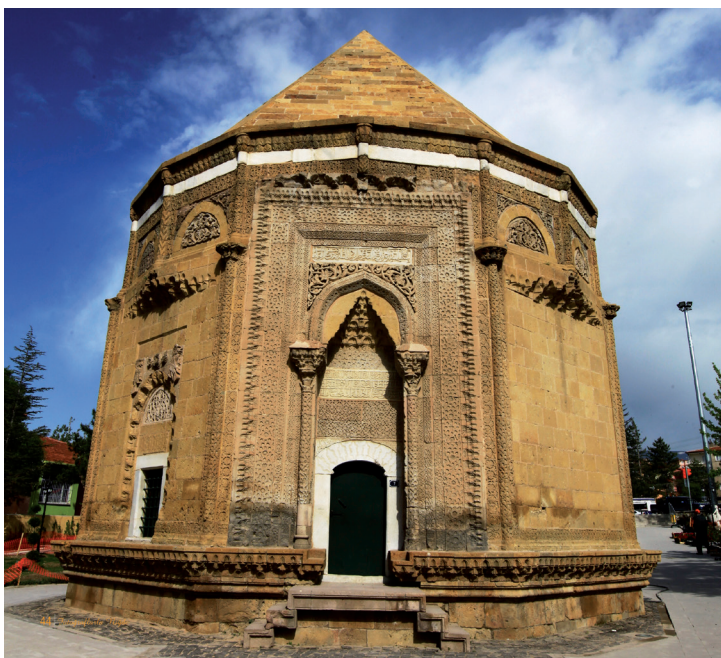
Le turbé de Hüdavend Hatun à Niğde.

mane. Il présente également de belles collections originaires de la ville assyrienne d'Acmhöyük, près d'Aksaray. Vous pourrez découvrir des momies dont celle de la « jeune religieuse blonde » ou celle du « jeune enfant », datant du XI e siècle et découvertes dans la vallée d'Ihlara dans les années 1960.