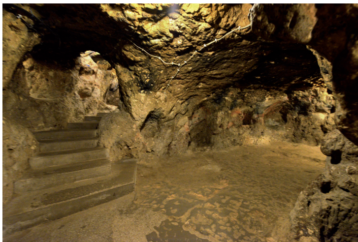
La ville souterraine de Derinkuyu.

L'une des vallées les plus mystérieuses de Cappadoce, un véritable décor de cinéma au milieu de la rase campagne où