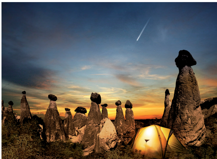
Faites l'expérience du camping en Cappadoce !

églises de Cappadoce. Les murs sont recouverts de nombreuses fresques, retraçant notamment l'histoire de saint Jean-Baptiste.