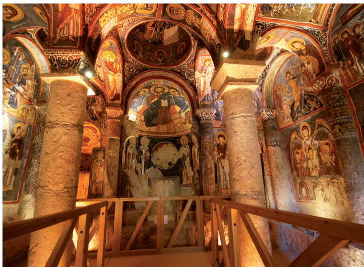
L'église Sombre à Göreme (Karanlık Kilise).

Située dans le « Musée de plein air », la Yılanlı Kilise (Église au serpent) est une église à simple voûte, à la nef longue et basse. Elle tire son nom de la fresque de Saint George et Saint Théodore terrassant le serpent. On y trouve également la représentation de l'empereur Constantin et de sa mère, Hélène, tenant la Vraie Croix. Un autre portrait intéressant est celui de saint Onuphrie près de l'entrée. Le prénom Onuphrie, épithète d'Osiris, vient de l'égyptien ancien et signifie « éternellement beau ou bon ». Après avoir vécu dans un monastère, il décida de vivre en ermite, dans la plus absolue pauvreté. Il s'installa près d'une source dans le désert égyptien près de Thèbes, avec la seule ombre d'un palmier, et vécut là 70 ans. Ses vêtements étant tombés en poussière, de longs poils lui poussèrent sur le corps pour les remplacer. Il vivait des dattes