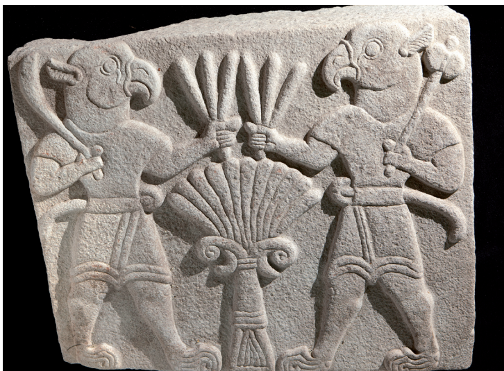
Relief néo-hittite à Arslantepe, Malatya.

caniques faciles à creuser et l'existence de sources permettent l'aménagement de véritables villes souterraines, avec greniers, étables, citernes, bassins, réfectoires, églises, habitations. Professé dès le début du VIII e siècle, l'iconoclasme refuse les images religieuses pour éviter l'idolâtrie, jusqu'à ce que ce courant soit déclaré hérétique en 843. Les victoires de l'empereur byzantin Nicéphore II Phocas contre les Arabes au cours de la seconde moitié du X e siècle amèneront en Cappadoce une période de paix et de prospérité. C'est à partir de cette époque que la Cappadoce voit se creuser et se peindre ses plus belles églises rupestres.