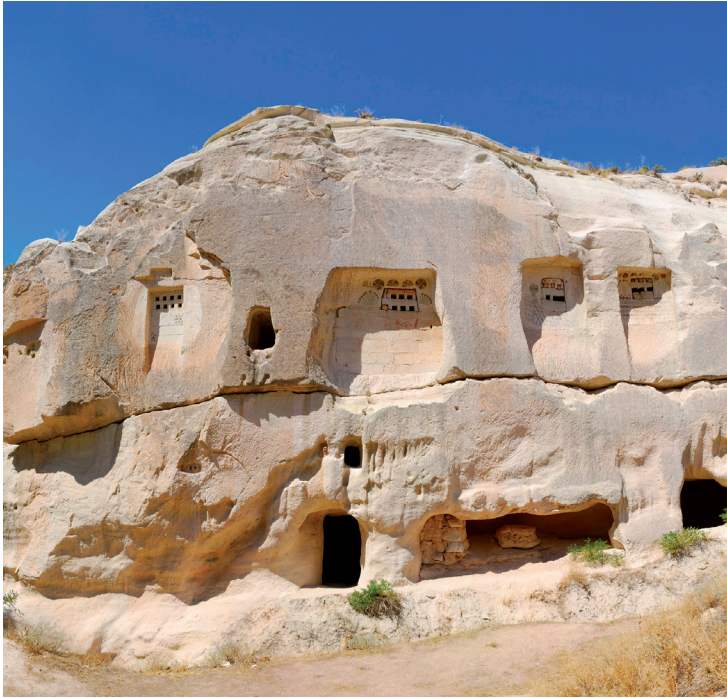
Un des nombreux pigeonniers de Üzengi Dere.