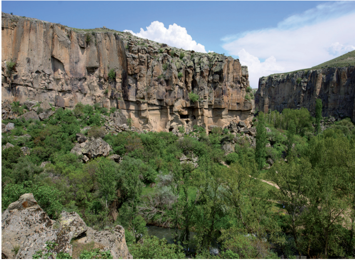
La vallée d'Ihlara.

Cet édifice a été bâti entre 1231 et 1236 pendant la période seldjoukide, sous le règne d'Alaaddin Keykubat, pour être achevé en 1239, sous le règne de Gıyaseddin Keyhüsrev. Il fait partie d'un ensemble de caravansérails construit au bord de la Route de la soie. Financé par un riche marchand du nom de Hoca Mesud , ce caravansérail est l'un des mieux conservés de Cappadoce. L'impressionnante porte d'entrée entourée d'une arche abrite des motifs de forme géométrique, représentatifs de la maîtrise de la pierre des artisans seldjoukides. Le site se compose de 13 tours soutenues par des contreforts. Vous remarquez son étrange couleur miel. Dans la cour intérieure, on retrouve deux fontaines et un masdjid.