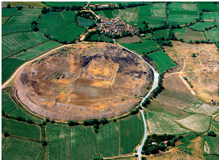
Kültepe - Kayseri.

Le site est constitué d'un tumulus de 21 m de hauteur et de 500 m de diamètre, entouré par les vestiges de la ville basse de Karum-Kanesh. L'ancienne