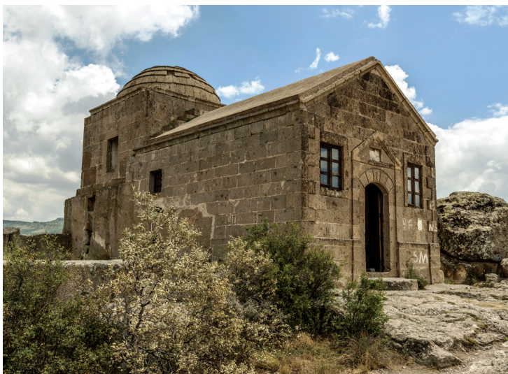
L'église Analepsis (Yüksek Kilise) de Güzelyurt.

le village dispose de quelques commerces et d'hébergements.