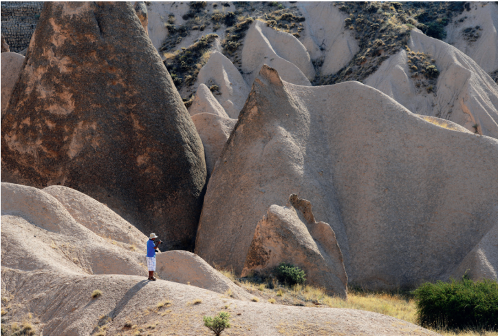
Ürgüp, la vallée de Devrent.

Cet immense marécage qui s'étend d'Erciyes au nord à Aladağlar au sud, est un écosystème unique et une référence mondiale pour les ornithologues. Composé de plans d'eau douce, d'eau salée et d'eau faiblement salée, ce site naturel abrite plus de 300 espèces d'oiseaux, tel que la glaréole à collier, l'avocette élégante, le crabier chevelu, l'ibis falcinelle, la spatule blanche, le canard chipeau, la grue, le cormoran pygmée, la marmaronette marbrée, le pluvier, le vanneau à épérons, la sterne hansel, la sterne naine qui viennent nidifier et s'y reproduire. Un lieu unique où la faune et la flore retrouvent leurs lettres de noblesse. Couverts de roseaux, d'iris et de nénuphars, les marais du Sultan, qui s'étendent sur un espace de 21 000 ha, ont été à raison classés zone protégée.