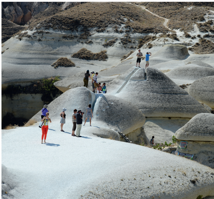
Zelve, vallée de Paşabağlı.

Comptez environ une heure pour effectuer la visite. Bienvenue dans ce