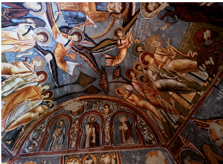
L'église à la Pomme à Göreme (Elmalı Kilise).

produites par le palmier, et de l'eau de la source. Onuphre est représenté par les différentes églises avec une longue barbe grise et des branchages autour du corps en guise de vêtement, tenant à la main une feuille de figuier. Selon certaines traditions, ce saint fut d'abord une femme aux mœurs légères, qui pria Dieu de la sauver. Dieu lui fit alors pousser une barbe et la rendit laide. C'est pourquoi Onuphrius est souvent représenté mi-homme mi-femme. L'église de Yılanlı abrite également d'autres fresques remarquables.