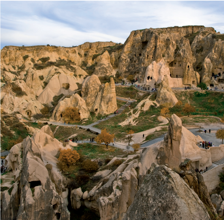
Musée de plein air de Göreme.

À 2 km de Göreme. Ouvert tous les jours, de 8 h à 19 h d'avril à octobre,