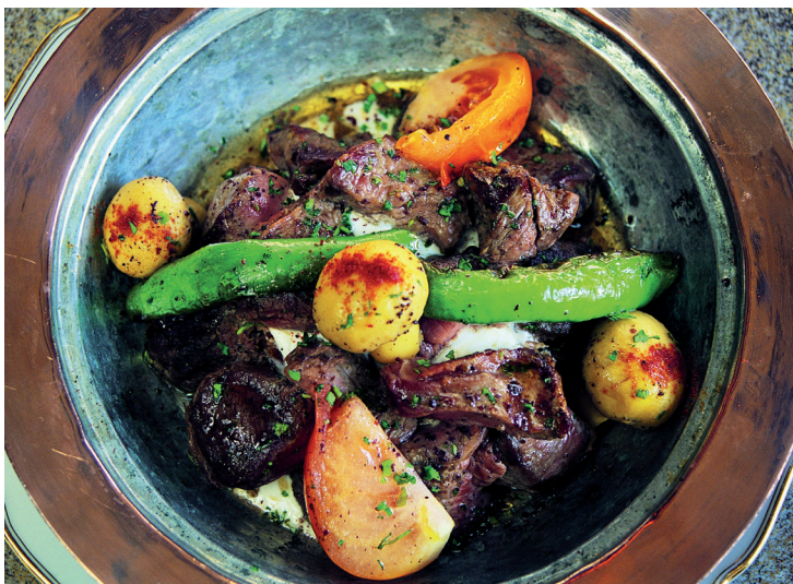
Un succulent plat turc.

très prisés et combleront votre appétit à tout petit prix.