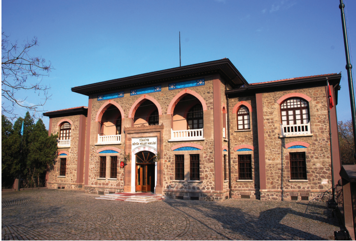
Musée de la République à Ankara (ancien bâtiment de l'Assemblée nationale).

La Turquie est devenue aujourd'hui l'une des plus grandes économies au monde et investit fortement au niveau international. En 1963, la Turquie conclut un premier accord avec la Communauté économique européenne. En 1995, elle rejoint l'Union douanière. Admise officiellement comme candidate en 1999, les négociations d'adhésion de la Turquie à l'Union européenne, commencées en 2005, sont toujours en cours.