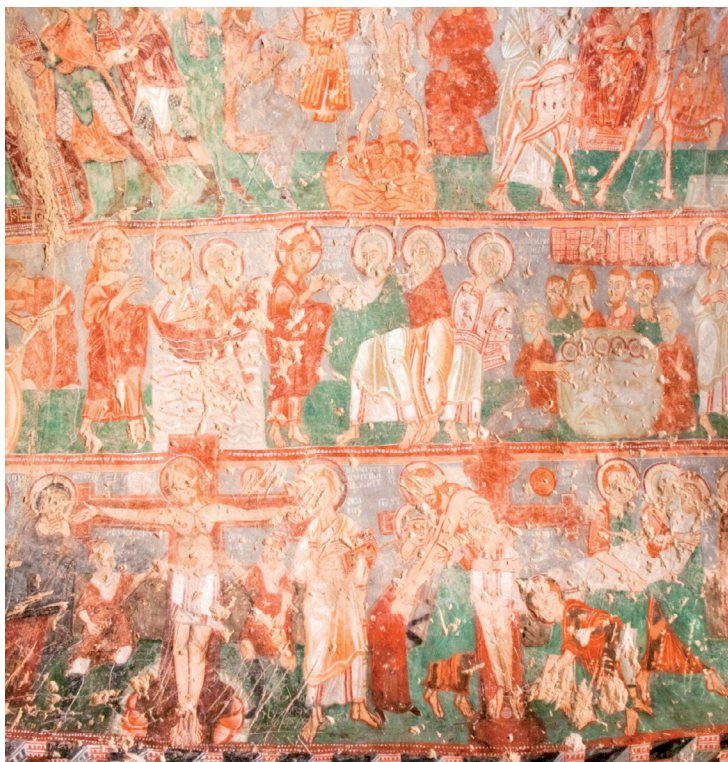
Splendide fresque à Göreme.

rition de volcans de moindre importance au fil des millénaires générèrent une superposition de strates plus ou moins denses. Au début du Quaternaire, des laves basaltiques beaucoup plus dures se déposèrent. Quelques éruptions eurent encore lieu ultérieurement, notamment en 253 av. J.-C. Les dépôts du mont Erciyes ont couvert à eux seuls une superficie de 10 000 km 2 , sur une épaisseur variant entre 100 et 500 mètres.