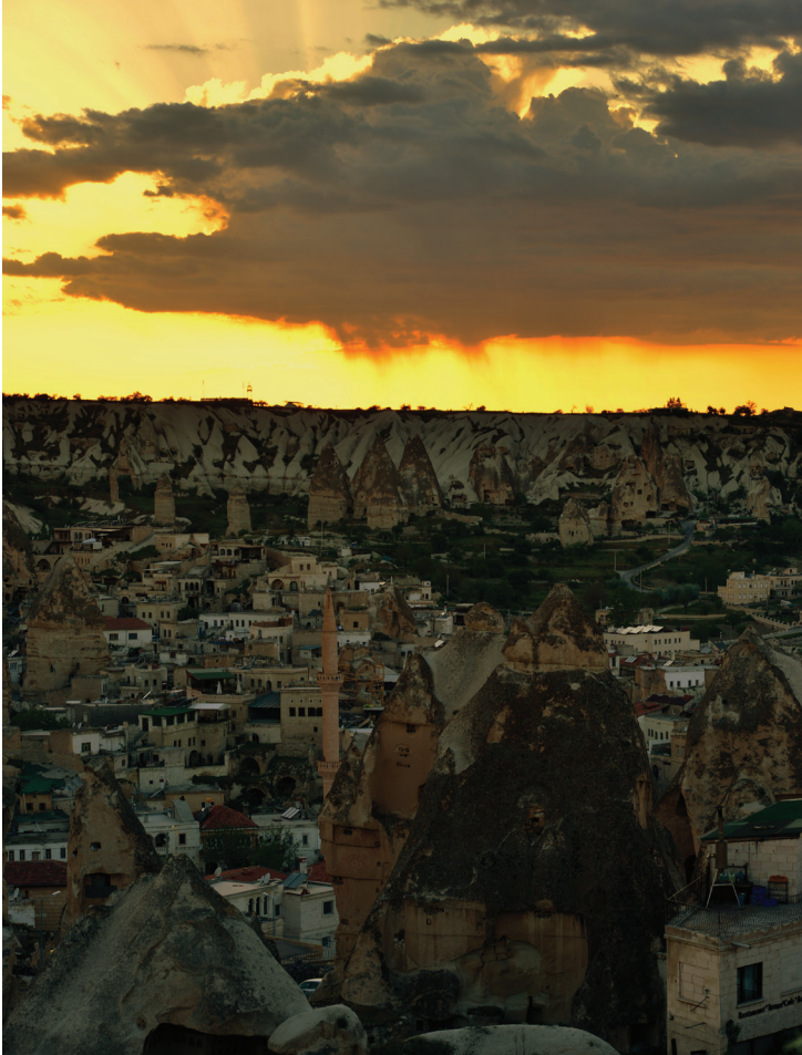
Vue générale de Göreme, Nevşehir.