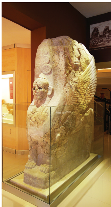
Hattousha : Le sphynx de Boğazköy, Çorum.

En 92 av. J.-C., Rome vint au secours du royaume de Cappadoce pour repousser le roi du Pont Mithridate VI, qui s'en était emparé. En 17, la Cappadoce est intégrée par Tibère à l'Empire romain. Sous la domination romaine, la région s'hellénise et se christianise : au cours des années 48 à 58, saint Paul traverse le pays au cours de ses trois voyages. Le christianisme s'y répand aux III e et IV e siècles, notamment sous l'impulsion de Basile, évêque de Césarée (Kayseri). Au VII e siècle l'est de la Cappadoce est envahi à plusieurs reprises par les Abbassides. Les incursions arabes continuant en Cappadoce jusqu'au IX e siècle, on assistera à la multiplication des souterrains dans la région. Les tufs vol-