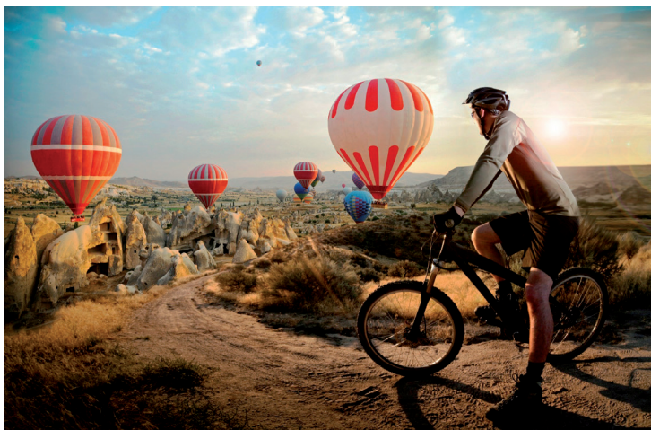
La Cappadoce à vélo reste un excellent moyen de découverte.