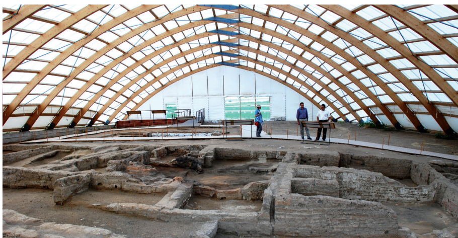
Le site néolithique de Çatal Höyük, Konya.

La Cappadoce fut habitée dès la période néolithique. On a retrouvé les premières traces de peuplement à Çatal Höyük, à environ 60 km au Sud-est de Konya. Elles remonteraient à environ 7000 av. J.-C. Parmi ces traces se trouve notamment une fresque murale qui montre, au premier plan, les habitations de la ville, avec en arrière-plan un volcan en éruption, que l'on pense être le mont Hasan. La fresque, exposée au musée des Civilisations Anatoliennes d'Ankara, est la peinture de paysage la plus ancienne au monde. Inscrite sur la liste du patrimoine culturel mondial de l'UNESCO, il s'agit de la première « ville » du monde selon les historiens, qui aurait compté jusqu'à 8 000 habitants.